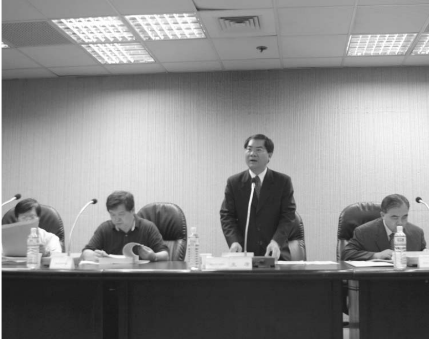
● 陳副主計長主持「94年綠色國民所得帳編製結果審查會」

球資源應為人類之永續發展而使用，為呼應本議題，世界各國乃積極推動綠色國民所得帳之研編。我國也自88年起依預算法第29條規定開始推動。為使帳表內涵符合國情，如何規範我國綠色國民所得帳之完整架構與資料內容，將是本業務面對最大挑戰，經研整下列四項策略為推動本業務之準則： 一、現有基礎理論探究：將有助於推動架構建立及內容規範。