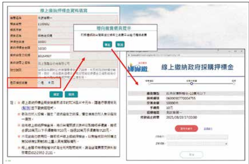
圖 1 廠商投標於採購網線上繳納押標金

採購網線上繳納押標金功能上線初期，機關提供線上繳納押標金件數僅 1,078 件，總