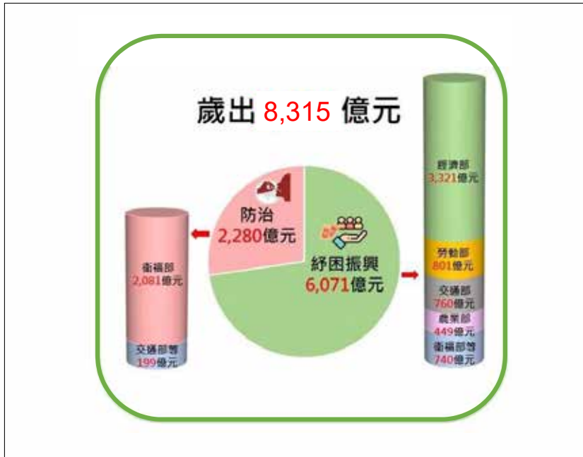
圖 2 中央政府嚴重特殊傳染性肺炎防治紓困振興特別決算