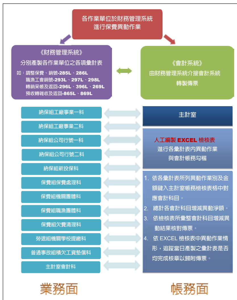
圖 1 災保法修正前勞工保險（含普通及職災）就業保險等保費及積欠工資墊償基金提繳費之每日異動會計處理作業

系統每日依各保險別、業務單位別、異動作業別分別產製各項表單，主計室將各該表單金額逐筆登載於其人工編製之檢核表相對應之會計科目，並彙計會計科目增減異動情形，與會計系統轉製之傳票金額及科目作帳務勾稽檢核，經確認檢核結果與傳票內容無誤後，尚須逐一蒐整各業務單位校對並完成核章之表單歸附傳票，帳務處理及憑證管理耗時費工（圖 1），而災保法施行後保費異動情形增加，將使會計處理作業更為複雜。