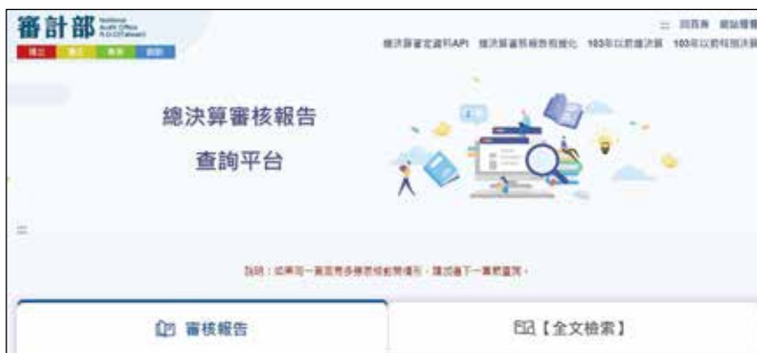
圖 2 總決算審核報告查詢平台

創新之核心價值，善用資訊科技研謀精進審計技術，致力發展審核報告創新作為，監督政府年度收支預算與施政計畫執行情形，以福國利民為目標，聚焦攸關國家長遠發展與重大民生等關鍵議題，從整體政府的宏觀視野研提審計建言，期能協助政府洞察潛存施政風險及前瞻未來挑戰，展現審計洞察及前瞻之專業能力，透由審核報告之公開報導，提升政府施政之效率、效能、透明與課責，促進政府良善治理，創造審計最大價值，落實國家永續發展。❖