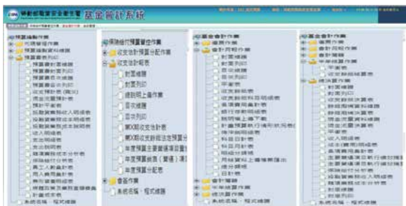
圖 4 各類報表產出功能畫面

各項勞工津貼發放、補助及預防、重建等業務均可順利進行。職安署藉由基金會會計系統改版，滿足管理階層對會計資訊之需求，有效提升工作成效，未來仍將秉持創新精神賡續檢討主計業務，期發揮支援機關決策之效益。❖