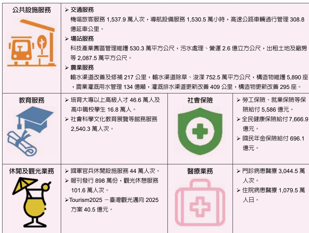
附表 111 年度預算中央政府作業基金主要營運項目