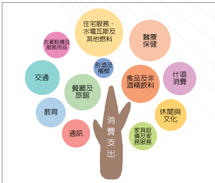
圖 1 消費支出分類