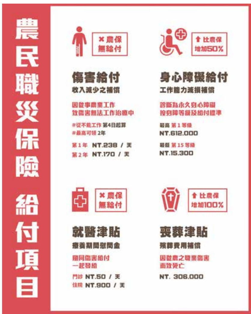
圖 1 農民職災保險給付項目