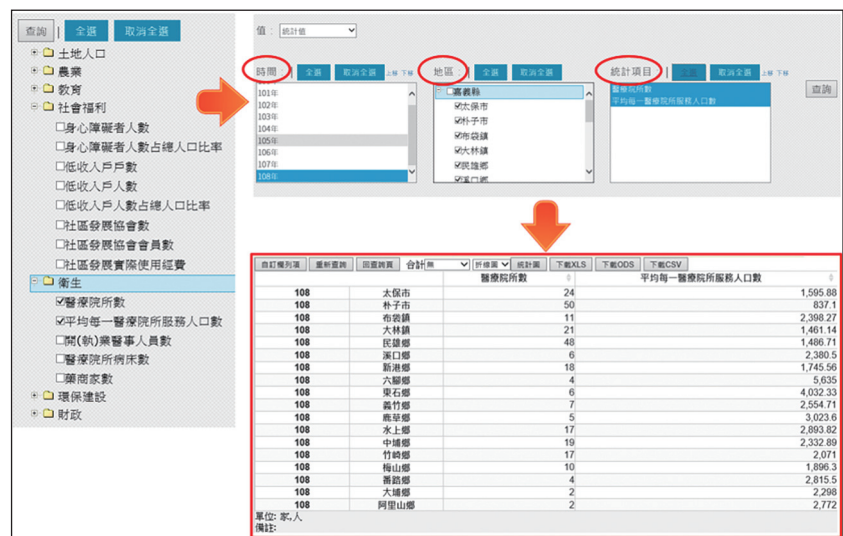
圖 3 嘉義縣鄉鎮市指標查詢網

為使各地方政府公務統計業務推動成果之網頁查詢介面標準化，以展現公務統計業務之整體性及應用性，依地方公務統計業務類別，規劃「統計法規及規範」、「公務統計方案」、「統計資料發布」、「性別統計」、「統計刊物」、「應用統計分析」、「統計資料查詢系統」及「視覺化查詢」等 8 大專區，並針對各專區內涵及查詢介面，提供一致性規範