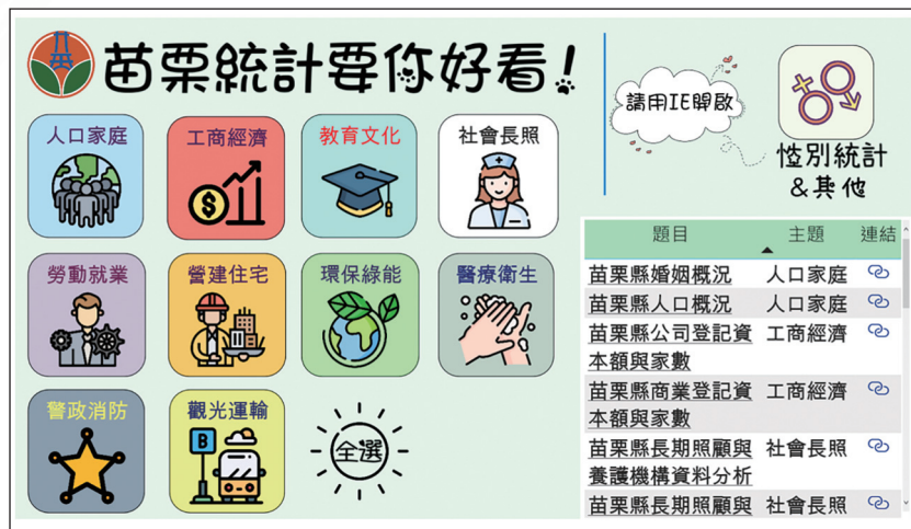
圖 4 苗栗縣視覺化互動式查詢網頁

積極推動的工作。主要基於共通性公務統計管理資訊系統有共通的資料字典、資料庫、應用定義及展現定義，再透過資料代碼一致、應用系統代碼一致、以及申請交換控管，將使此目標很快的達成。