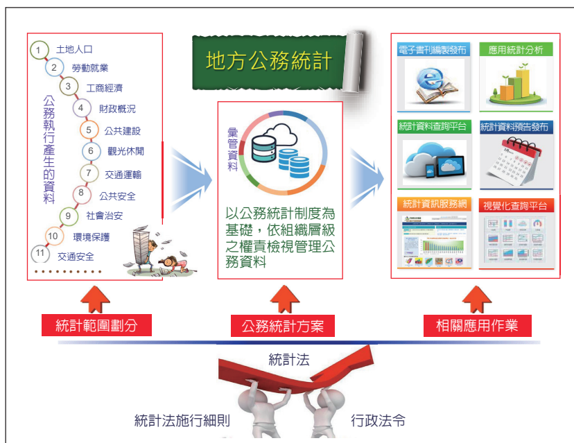
圖 1 地方公務統計工作的基本精神與準則

地方政府各有各的「統計花園」，有的深耕已久，有的剛起步耕耘，考量地方統計業務具有共通性，以及資源有限