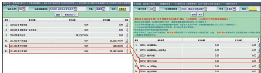
圖 6 新普會制度首年開帳作業之特殊處理

異動為方向，將所有系統表件區分為 3 大區塊進行調整，盡量由後端程式解決普會制度間的差異，以提升使用者便利性，同時符合法規要求為目標。