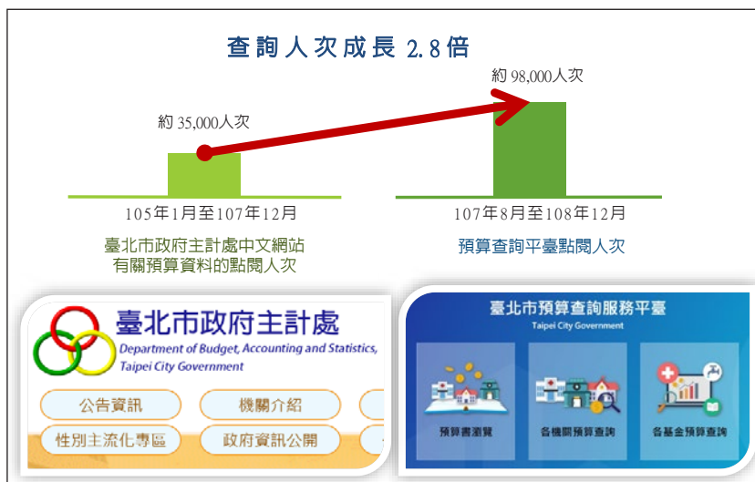
圖 4 本府預算查詢人次成長情形

本府 107 年以預算公開一站服務之創新策略，突破既有紙本預算書與人工查閱及檢索之作業模式，108 年貫徹創新策略並持續精進加值服務，以推動議員及本府主計同仁以更有效的方法，協助各機關促進預算更妥適的配置。預算查詢平臺秉持著落實政府資訊公開法精神，協助本府各機關以最便捷的方式將預算書資訊與人民共享，並以不同的角度與面向呈現預算數據，增進人民對本府施政政策之了解與信賴，以促進市民與本府共同努力打造一個更美好的臺北。❖