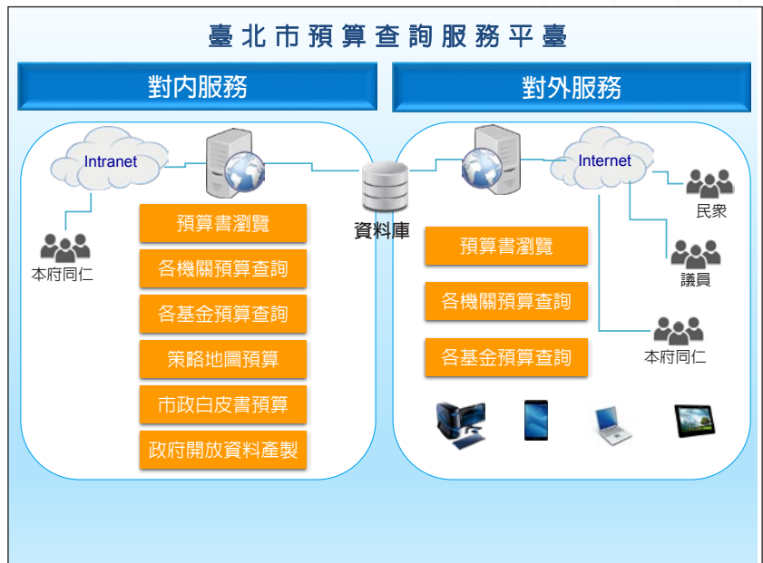
圖 2 預算查詢平臺功能

(一) 對外服務係平臺對外提供之預算書瀏覽及各機關（基金）預算資料查詢服務，其中預算書瀏覽功能係透過預算書目錄，以利使用者查閱總預算書、附屬單位預算及綜計表、主管預算書及單位（附屬單位）預算書等各項預算書表，並可下載電子檔（PDF檔）。至各機關（基金）預算資料查詢功能，提供可依篩選條件或選取