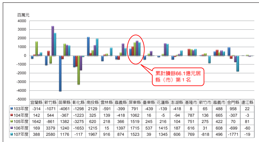
圖 1 103 年度至 107 年度各縣（市）歲入歲出餘絀（決算數）概況

屏東縣人口數僅次於六都及彰化縣，長期被定位農業縣，產業遭遇瓶頸，農林漁牧產值年達 7 百億餘元，但卻無法轉為實際稅收，102 年度至 107 年度自有財源占歲出比率（決算數）及自籌財源占歲出比率（決算數）之平均值分別為 45%、21%，遠低於六都 77%、55% 及縣（市）50%、28%（下頁圖 2 及圖 3），雖有中央一般性及平衡預算專案補助，惟財政仍顯捉襟見肘。行政版圖重劃為六都十六縣（市）後，現行財政資源分配的重要規範（財政收支劃分法）未適時配合區域整併修正，即便各縣（市）政府努力改善財