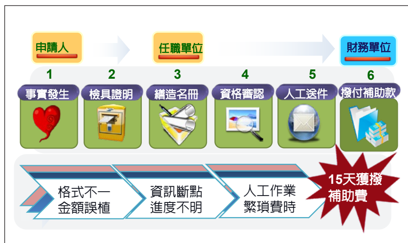
圖 1 原始作業程序示意圖

依戶籍法規定戶籍登記係指結婚、出生及死亡等身分登記，戶籍謄本所載內容為確認人民權利義務關係之重要依據，亦屬申請補助事實之主要證明，為減省申請人蒐整證明資料時間，提升費款審核撥付效率，爰構思透過內政部戶政一站式服務，讓申請人於戶政事務所辦理戶籍登記時，即同步完成申請，運用「政府網際服務網」鏈結國防部作業系統提供戶籍訊息，由上而下管制任職服務單位自接獲通報起，主動協助申請人檢整佐證文件，迅速完備行政程序，任職服務單位及地區財務單位將於收到戶籍資料 5 個工作日內完成審核及撥付作業（下頁圖 2）。