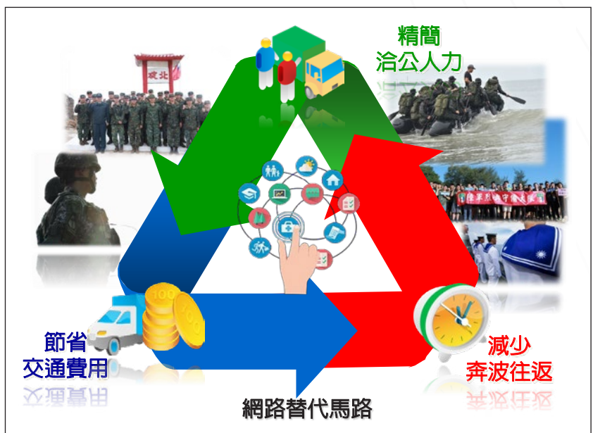
圖4 網路替代馬路示意圖