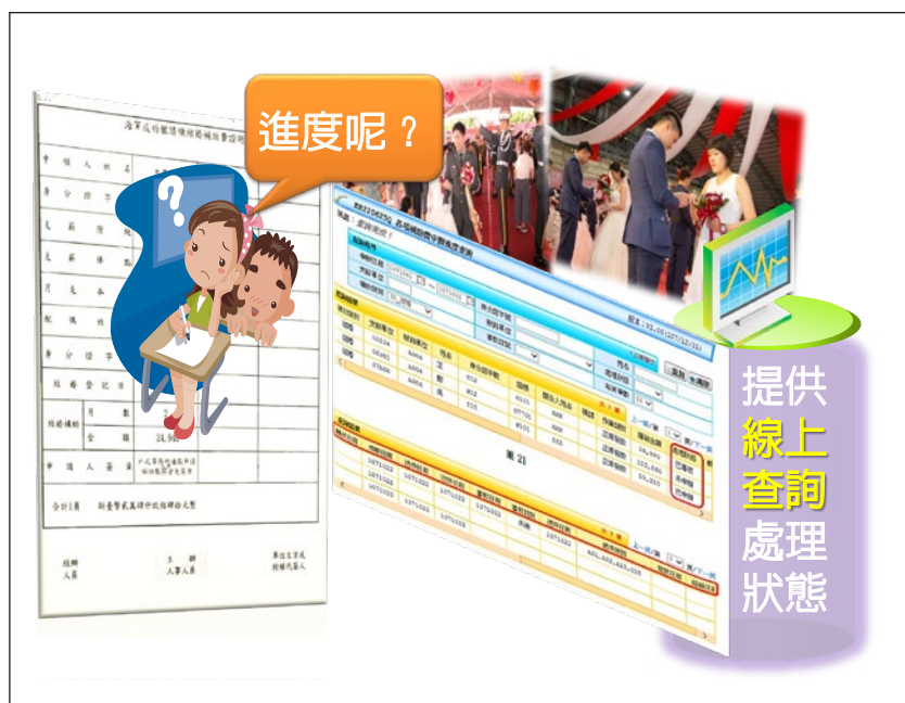
圖 5 線上查詢畫面

經統計截至 108 年 12 月止，國軍人員透過「跨機關通報申請補助費服務」申領件數計 4,457 件，其中申領結婚及喪葬補助（不需補付其他佐證資料）計 3,284 件（占申請件數 73.7%），較過往申辦作業