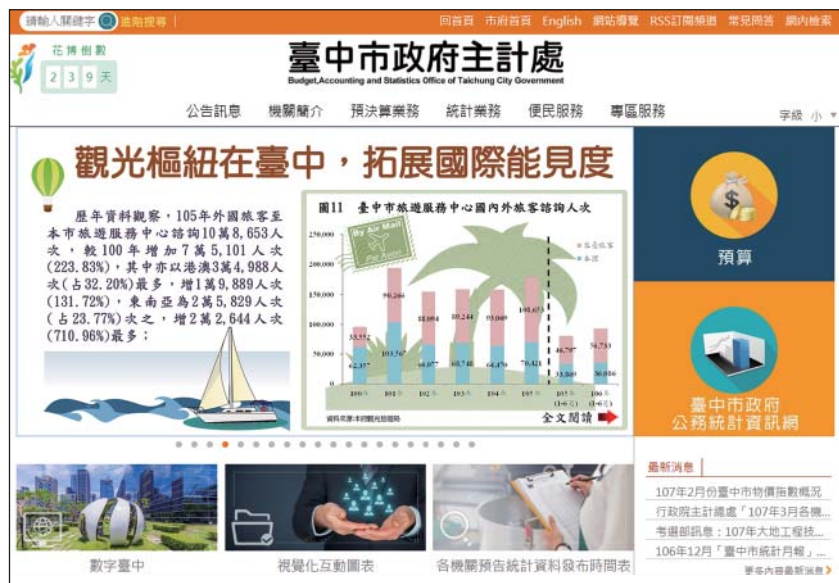
圖4 本處網站首頁統計引導小圖範例