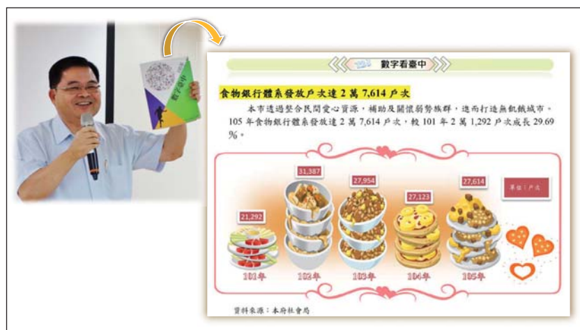
圖 2 蔣處長於本處統計業務研習會介紹數字臺中書刊

除紙本刊物外，網頁更是網路時代重要的傳播媒介，本處於 105 年起開始利用 SAP Xelsius 軟體，針對消防、刑案、公共運輸等 16 項主題，建置視覺化互動圖表，且持續按年更新並擴充各項主題建置，從平面靜態之統計圖，近一步蛻變為具動態性質之主題視覺化互動圖表，民衆可以瀏覽有興趣之主題，透過滑鼠操作，看到統計圖的升降起落變化，