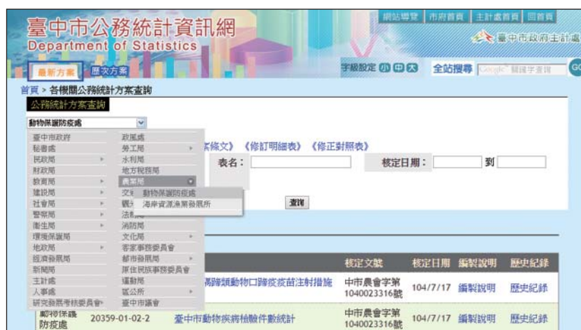
圖 1 「臺中市公務統計資訊網」機關現行方案功能及便於查閱之階層式機關選單示意