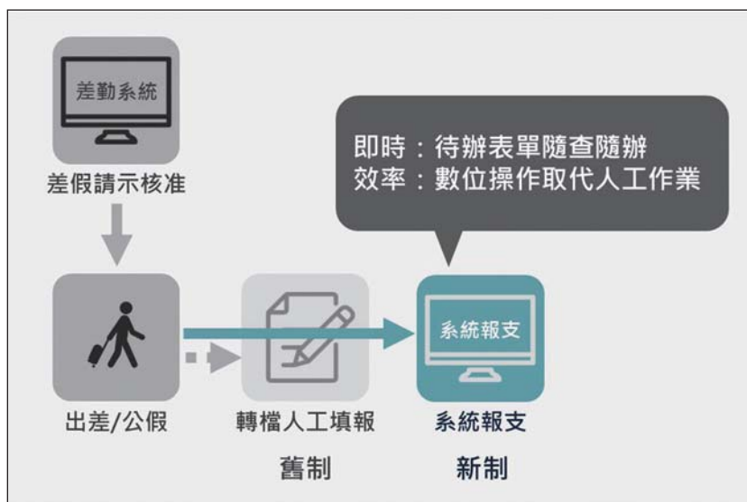
圖 2 差旅費報支流程