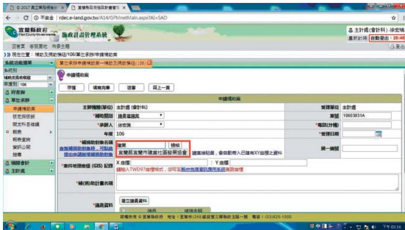
圖 2 系統畫面展示（檢核功能 1 - 按鈕）