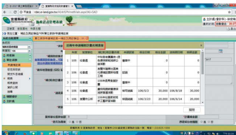
圖 3 系統畫面展示（檢核功能 2 - 近兩年申請補助計畫名稱清單）