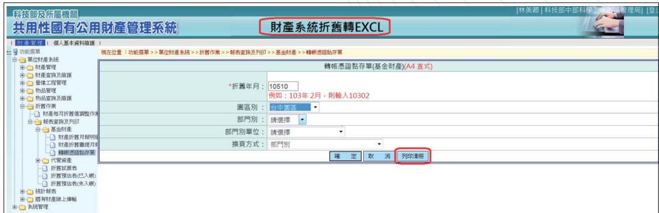
圖 1 由財產系統轉出