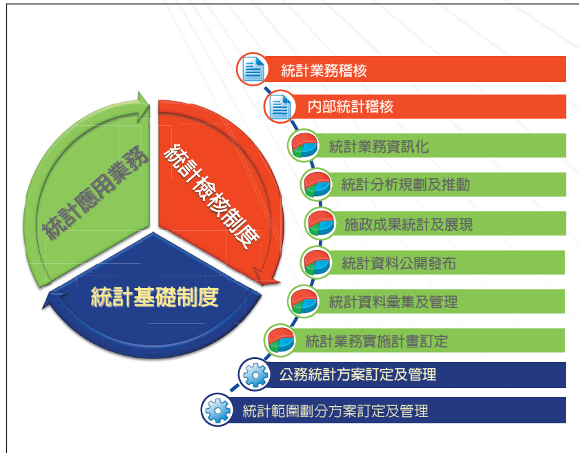
圖 1 地方政府完整公務統計制度

本中心經以自行研訂之系統功能規格，結合地方政府資源於 104 年 12 月完成共通性公務統計管理資訊系統，系統功能包括施政資料彙管、電子書刊編製發布、統計資料查詢平台、主管決策查詢，以及整合系統內之重要統計資料提供查詢之統計資訊服務網等 5 大功能（圖 2）。另本系統係以共通性理念設計，並建置於行政院主計總處廣博大樓機房，採雲端方式連線作業，惟因囿於人力，將採循序推動方式推廣輔導，目前嘉義縣政府已參與