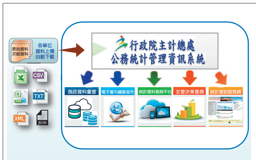
圖 2 地方政府公務統計業務資訊化運作平台