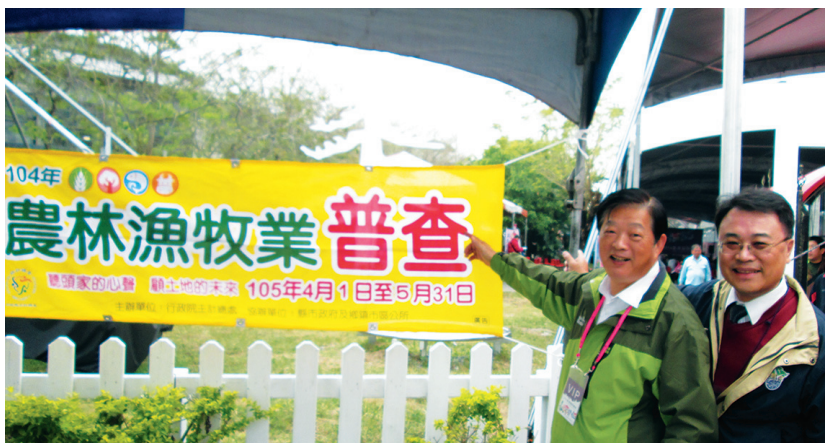
圖1 2016臺灣國際蘭展農業局局長（左）與副局長（右）親自懸掛普查布幔，宣導普查訊息