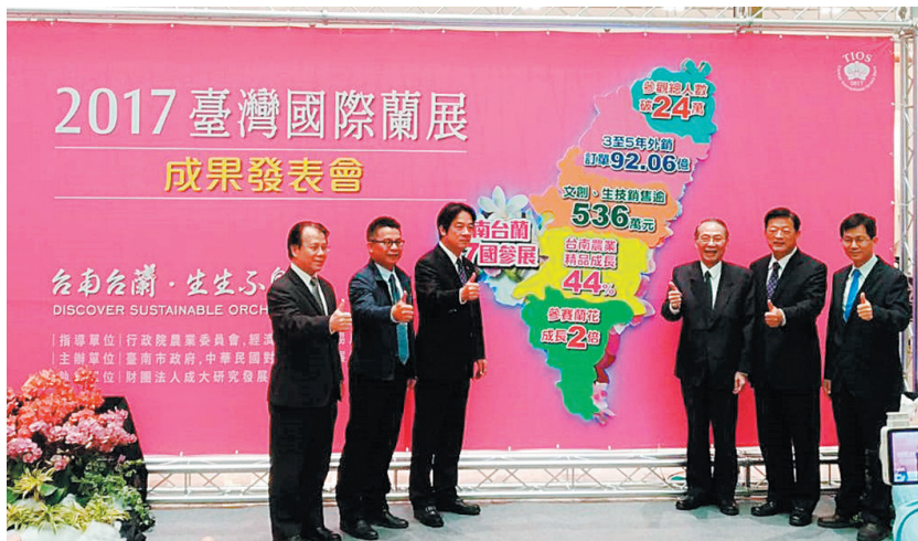
圖 5 「2017 臺灣國際蘭展」成果發表會