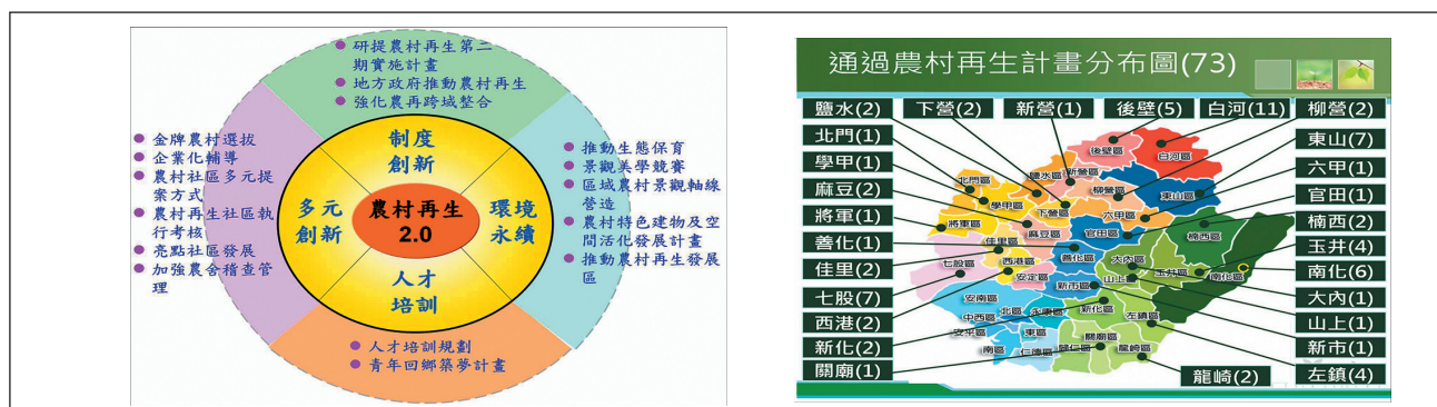
圖 6 臺南市農村再生計畫

肥水施灌農地政策，以建立畜牧業節能永續產業；精進淺海牡蠣養殖管理作為，研議以蚵棚設置晶片管理機制模式，以掌握海上放養蚵棚數量之資訊，管控養蚵業者後續回收蚵棚的狀況，並持續推廣補助套網包覆保麗龍使用，兼顧海岸環保的責任。期能藉由以上之創新思維作法，進一步而達到綠色、健康的循環農業目標。至於政府部門如何掌握農業訊息，以制定符合全民利益的農業發展方向，亦是推動農業發展政策的重要課題，本次普查結果將作為相關施政成果之重要評估參據，同時也期許在下一次的農林漁牧業普查結果能夠看到臺南市農業發展的好成果。❖