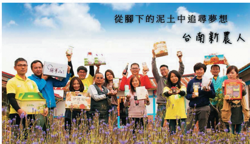
圖 2 從腳下的泥土中追尋夢想－臺南新農人