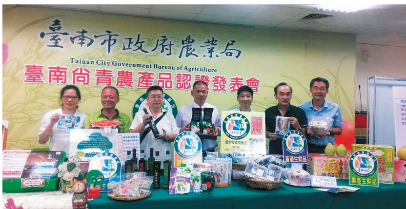
圖 4 臺南尚青農產品認證