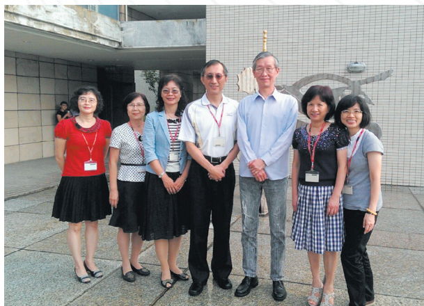
● 6 位作者與鹿前副主計長攝於主計人員訓練中心

104 年苗栗縣政府爆發嚴重財政危機，引發國人關注，財政紀律已成為舉國正視的嚴肅課題。本文謹就當前地方財政之現況及問題加以探討，並提出相關因應策略，俾供推動地方財政改革之參考。