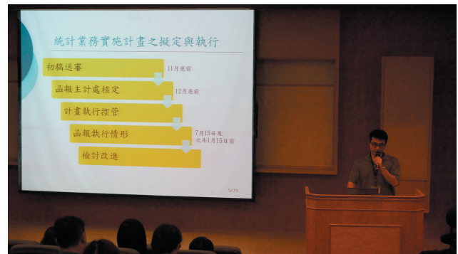
●桃園市政府辦理104年公務統計實務研習情形