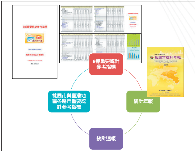
圖 3 桃園市政府定期彙編之統計刊物