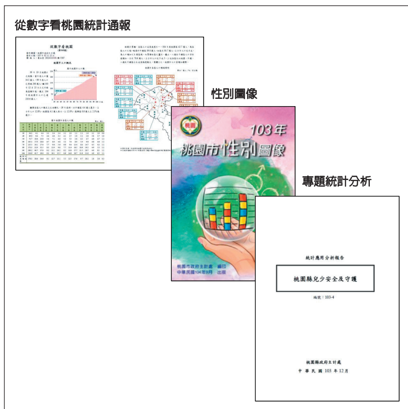
圖 5 以統計數據分析社經議題

隨著基礎規制逐漸落實於主計及業務單位，並同時提升公務統計之服務與應用品質，本府期能以統計數據，客觀展現各項施政成果，並發揮統計支援決策功能。❖