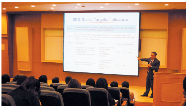
●前聯合國統計司司長專題講座