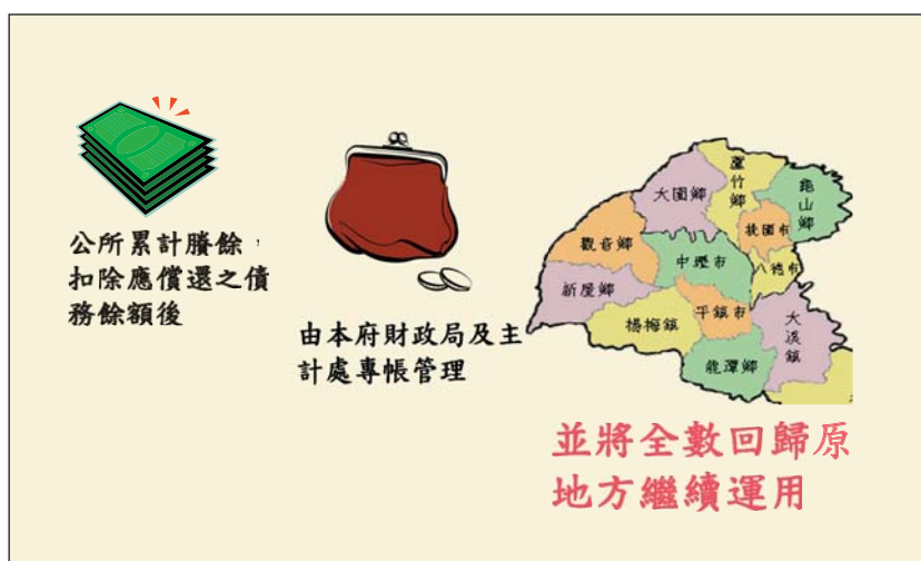
附圖 誘因機制—累計賸餘滾存續用