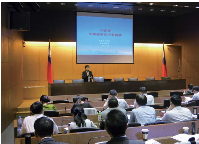
圖 2 外交部辦理內部控制及內部稽核教育訓練情形

104 年度業依行政院訂頒之內部控制相關規定辦理自行評估及內部稽核，自行評估結果發現內部控制制度 27 項控制作業於設計面均為有效，惟執行面有 7 項評估重點為未符合，包括外交及國際事務學院出納人員擔任相同工作 6 年以上及部分領務業務少數館處未符合規定等，占執行面評估重點總項數之 3.06%，顯示各項控制作業大部分均能有效執行。而前述 7 項評估結果為未符合之項目，主要係評估重點中，倘某項評估重點有任一駐外館處或單位經評估為未符合，則該項