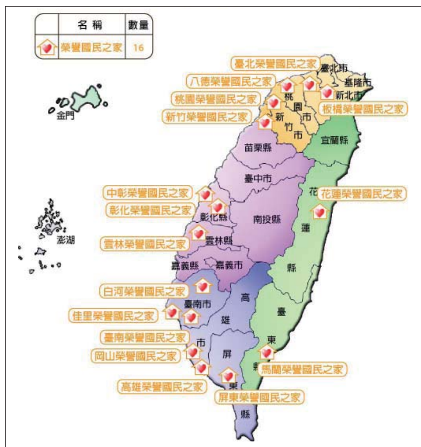
圖 1 榮家分布圖

榮家之設立本有其歷史任務，係為收容單身無依且身心障礙或年老無工作能力之退役榮民，使其能獲得最妥善之照