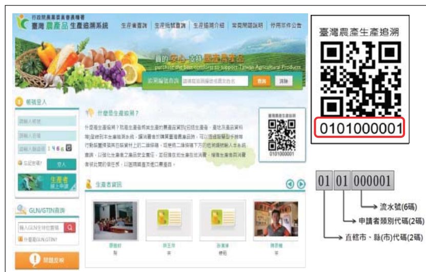
圖 3 臺灣農產品生產追溯