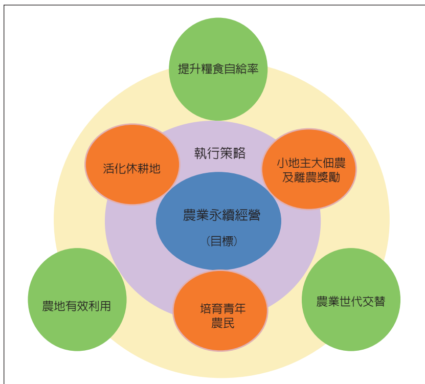
圖 2 調整耕作制度活化農地與配套措施及成效示意圖

鼓勵無力耕種之老農或無意耕作之農民，將自有土地長期出租給有意願擴大農業經營之年輕專業農民或農民團體，獎勵承租農地種植具進口替代或出口競爭之農作物，並提供資深農民離農獎勵，使其安心享受離農或