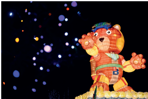
● 副燈－臺灣酷比熊