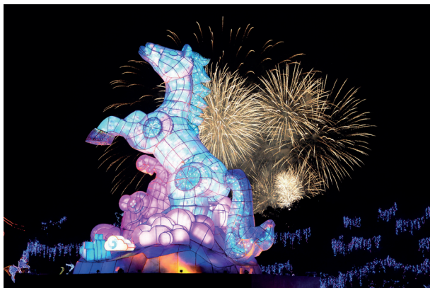
● 主燈－龍駒騰躍

贊助，大幅度減少縣政府經費支出，至於縣府免費發放民衆「超萌馬」小提燈，因合約簽訂小提燈把手印製贊助單位 logo 宣傳廣告，亦只需支付部分的材料費。燈會展區分成南、北及主燈區，各區又依不同特色再分成 22 個展覽區域，其中首創「里仁燈區」是邀請南投縣 17 個