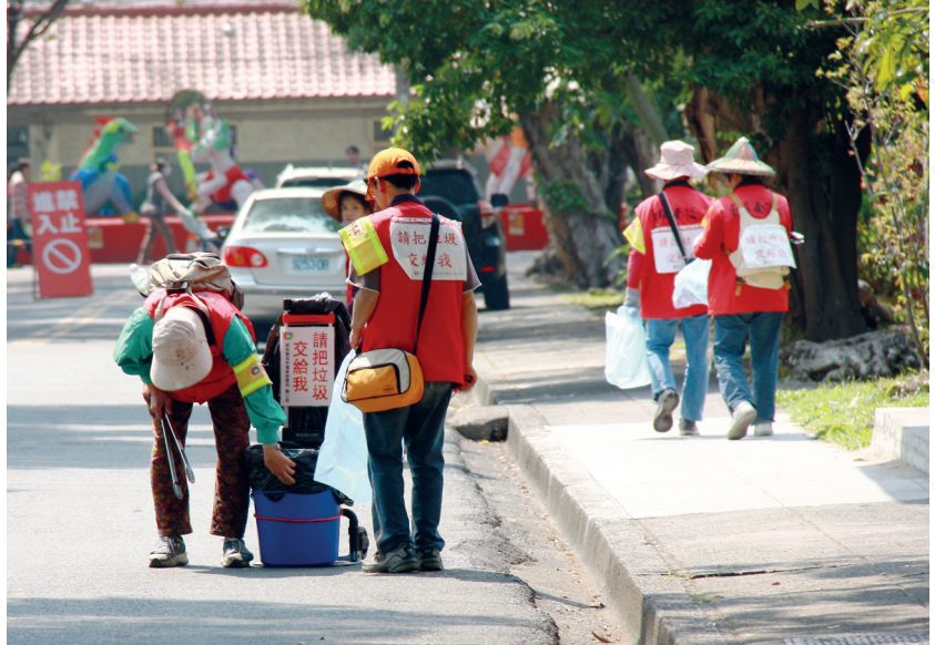
●環保志工執行「請把垃圾交給我」巡收垃圾情形

工具無法承載燈會每日眾多的人潮，須設置接駁轉運站來疏運遊客，以過去兩年臺灣燈會平均每日遊客流量預估參觀人數，綜合考量停車場數、接駁路線等變數，推估所需接駁車量、轉運站及需求預算。接駁的另一個難題為燈區之南、北聯外道路車道數量不足，無法負荷燈會期間預計的車次流量，將會造成嚴重交通堵塞，為解決道路容量不足，實施交通管制，將部分道路限制僅供大客車及特種車輛通行，避免交通壅塞回堵，使轉運站