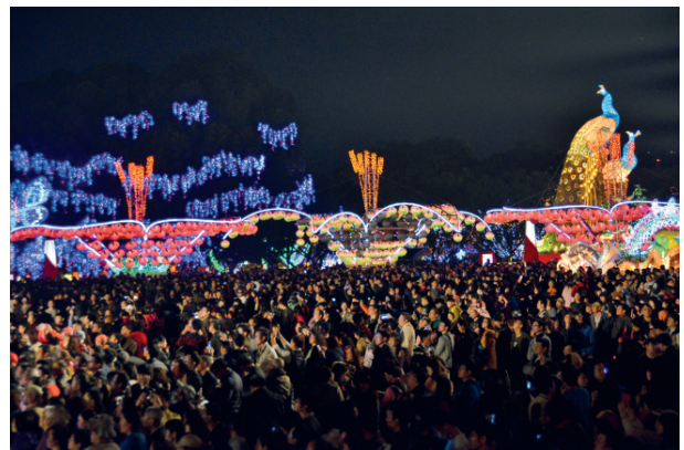
● 開幕點燈萬人空巷情景及副燈－珍禽爭艷