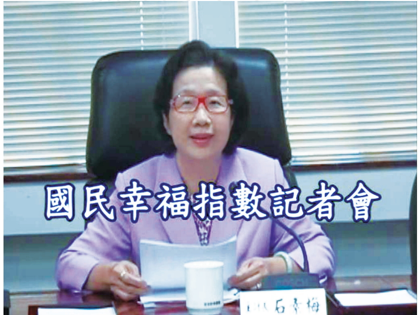
● 石主計長主持國民幸福指數首次公布記者會

我國國民幸福指數架構遵循 OECD 美好生活指數（Your Better Life Index, BLI），涵蓋與物質生活條件有關之居住條件、所得與財富、工作與收入等 3 個與經濟面相關性較高的領域（上頁圖 1）；此外，尚包括非經濟層面且與生活品質有關的社會聯繫、教育與技能、環境品質、公民參與及政府治理、健康狀況、主觀幸福感、人身安全、工作與生活平衡等 8 個領域，共 11 個領域。為兼顧跨國評比及國情特性，各領域下併列國際指標與在地指標計 62 項，其中 24 項國際指標定義及內涵完全採自 BLI，並用以編算綜合指數，與 BLI 涵蓋的 34 個會員國及巴西、俄羅斯 2 個夥伴國進行比較；在地指標經多次專家學